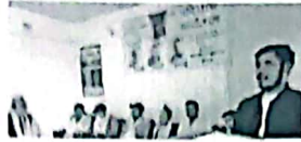
आजकै चुनाव तयारपारेका उम्मेदवारको बैठकमा सहभागिता गरिनेछ।

इच्छाका साथै बहादुरताका साथ प्रजातन्त्रको रक्षाका लागि चुनावको आव्हान गरिनेछ।